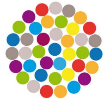
Inklusion Teil werden