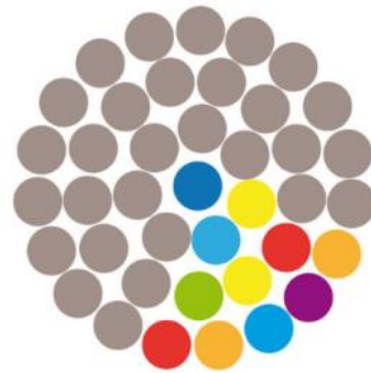
Integration Mitmachen lassen