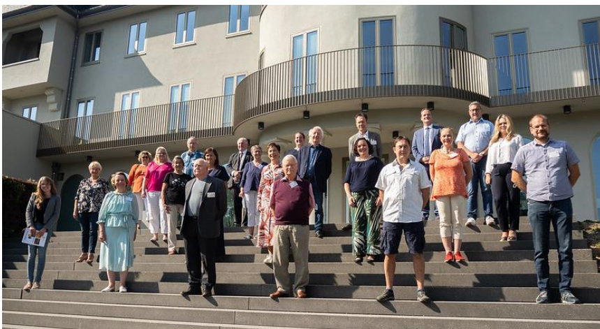
Bürger-versammlung 2020

Diese Vorschläge leiten sie an das Parlament weiter.