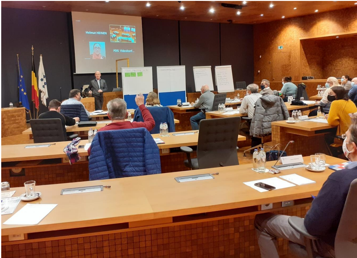
Abb.3 Mittels Kartenabfrage und Diskussion wird folgende Ausgangsfrage beantwortet: „Wie lautet aus meiner Sicht in dem gerade ausgewählten Handlungsfeld die Kernfragestellung für die Arbeit der nächsten Bürgerversammlung“:

U. a. werden folgende Vorschläge genannt und diskutiert: